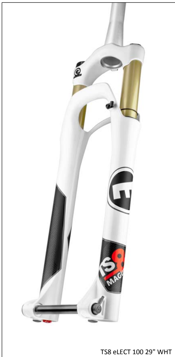
TS8 eLECT 100 29" WHT