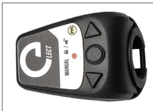
eLECT リモートユニット